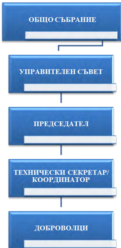
Структурата на БФСВ – схема

Български спортен тотализатор /БСТ/ Български футболен съюз /БФС/ Българска спортна федерация /БСФ/ Български туристически съюз /БТС/ Спортни клубове - спорт за всички /членове в БФСВ/